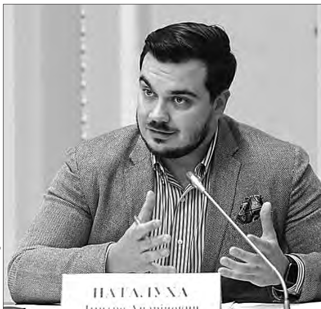
Він додав, що не менш важливим питанням є налагодження економічних і торговельних відносин, поглиблення співробітництва в оборонній і технологічній сферах.

«Ми працюємо в кількох напрямках. Передовсім намагаємося переконати ці країни активніше долучитися до реалізації мирного плану Президента України Володимира Зеленського. Наприклад, Чилі вже взяла на себе зобов'язання щодо п'ятого пункту Формули миру, який стосується відновлення територіальної цілісності. У цьому ж напрямку активно працює Аргентина. Друге питання — повернення наших дітей, депортованих рф. Партнерам зрозуміла ця трагедія, і вони готові виступити посередниками, помічниками й заявили, що приєднуються до міжнародної коаліції з повернення українських дітей», — зазначив політик.